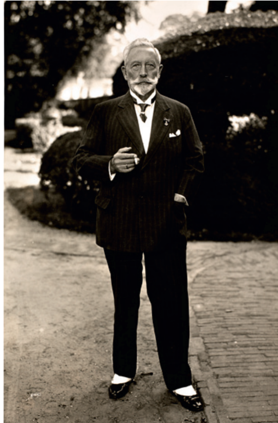
Wilhelm II in het park van Huis Doorn in september 1933

'Heeft uw Raad voor Cultuur ooit van Europa gehoord, of van Europese cultuurgeschiedenis?'