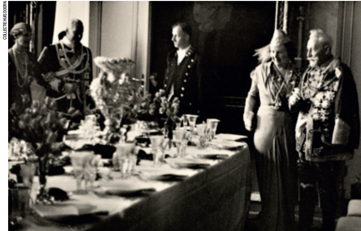
Wilhelm II, rechts, begeleidt prinses Juliana naar haar plaats voor een diner, 2 mei 1938

Wie de documenten erop naslaat, moet erkennen dat het oordeel van de Raad voor Cultuur